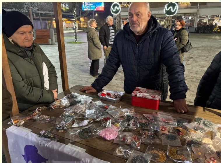
3. Donacijski štand u sklopu Županjske zimske bajke 2025.