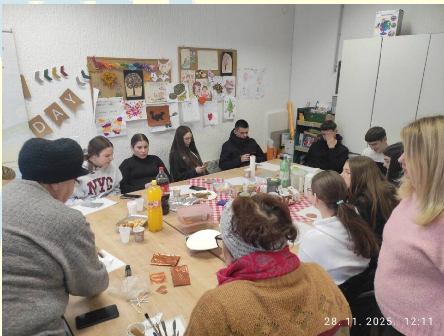
5. Kreativna radionica s Obrtničko-industrijskom školom u programu „Korak u samostalnost“ pod vodstvom volonterke i voditeljica programa, 2025.