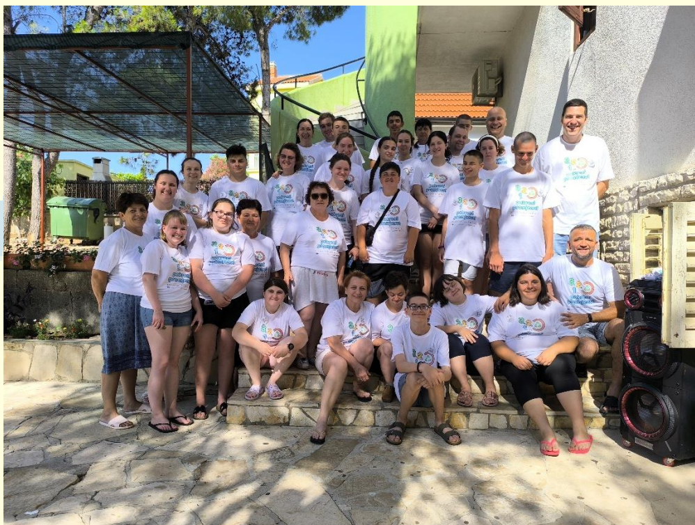
4. Razmjena mladih 2025. udruga „Golubovi“ Županja (RH) i ŠOSO „Vuk Karadžić“ Sombor (SRB)