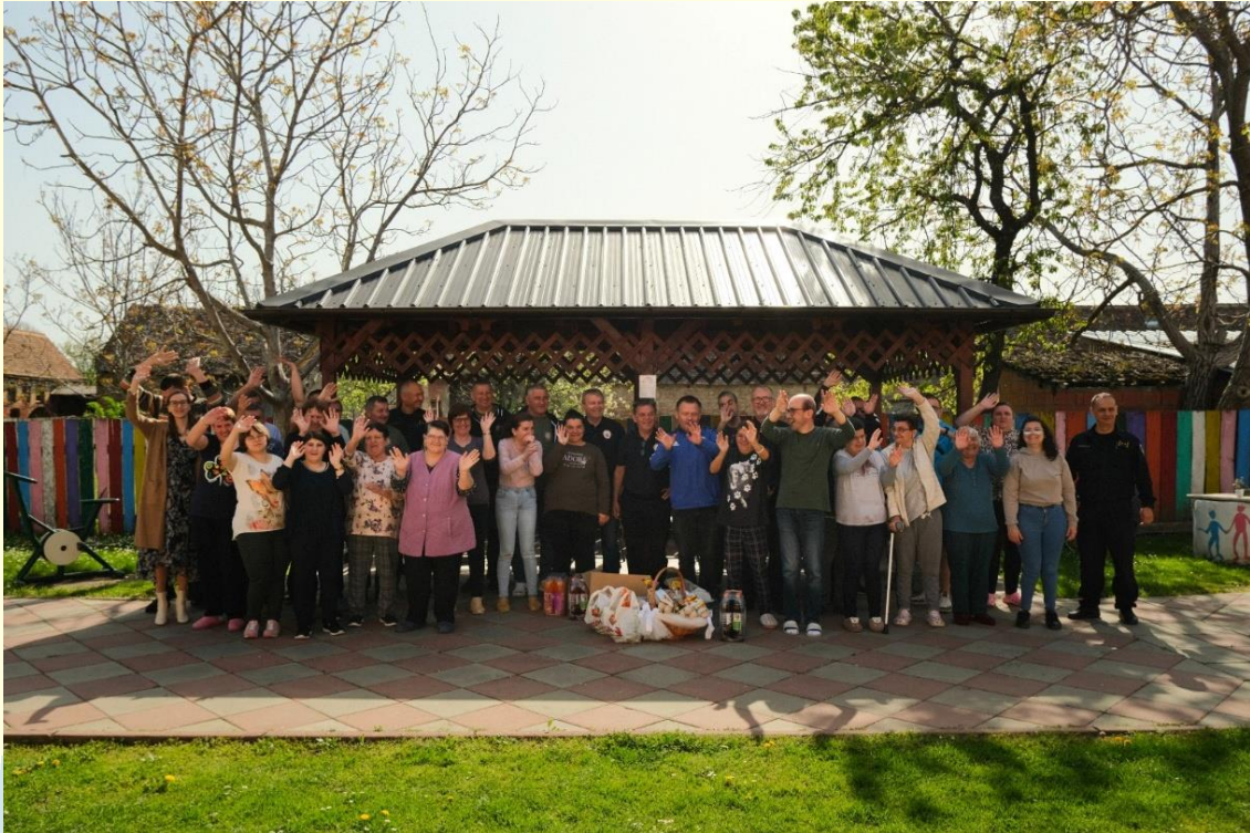
1. Posjeta i darivanje od strane RBK Kotur Županja, Motokluba Županja, UDVDR RH i GO UHDDR Županja