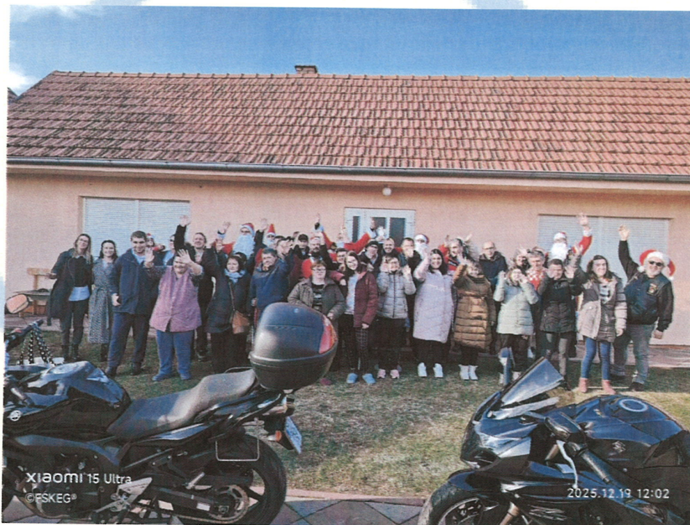
8. Posjeta Moto mrazova (MK Županja) članovima udruge ususret Božiću 2025.

Posebna i neizmjerena zahvalnost upućuje se djelatnicima i voditeljicama Cjelodnevnog boravka GDCK Županja na velikodušnoj pomoći u svim aktivnostima i suradnji koja nam znači više nego riječi mogu opisati.