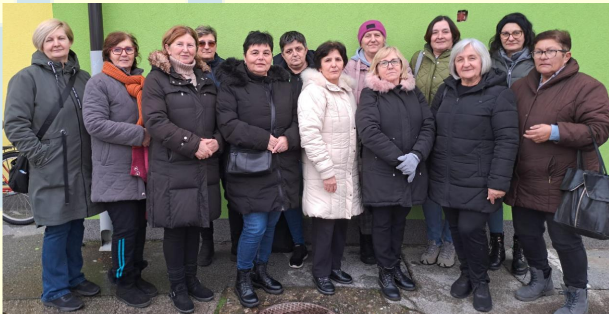
7. Žene pružateljice usluga programa Zaželi – prevencija institucionalizacije nakon koordinacijskog sastanka, 2025.

→ Zajednički cilj grada Županje, navedenih Općina i udruge „Golubovi“ je podizanje svijesti o potrebama osoba s invaliditetom, a sve s ciljem unaprjeđivanja položaja ranjivih skupina, te razvoj civilnog sektora na našem području. Društvo za pomoć osobama s invaliditetom „Golubovi“ Županja jedna je od rijetkih udruga koja provodi institucionalnu skrb o osobama s invaliditetom i koja pruža usluge pomoćnika djeci s teškoćama u razvoju. Udruga do kraja 2025. godine broji 274 članova, s tim da je od 274 članova njih 106 aktivno/platilo članarinu za 2025. godinu. Uključivanjem djece i mladih s teškoćama u razvoju te odraslih osoba s invaliditetom u projekte, programe i aktivnosti udruge prevenira se njihova institucionalizacija i izdvajanje iz obitelji. Integracija djece s teškoćama u škole stavlja ih u ravnopravan položaj s vršnjacima, omogućuje razvoj usmjeren prema samostalnom i aktivnom življenju u budućnosti, osnažuje djecu s teškoćama u razvoju glede njihova samopouzdanja, povećanja nivoa znanja, vještina, te svladavanje školskog gradiva i kontinuirano praćenje i pohađanje nastave.