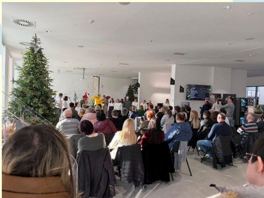
2. Sudjelovanje na obilježavanju 3 godine postojanja Centra za pružanje usluga u Vukovarsko-srijemskoj županiji